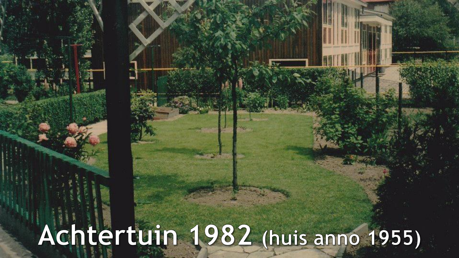
Achtertuin 1982 (huis anno 1955)